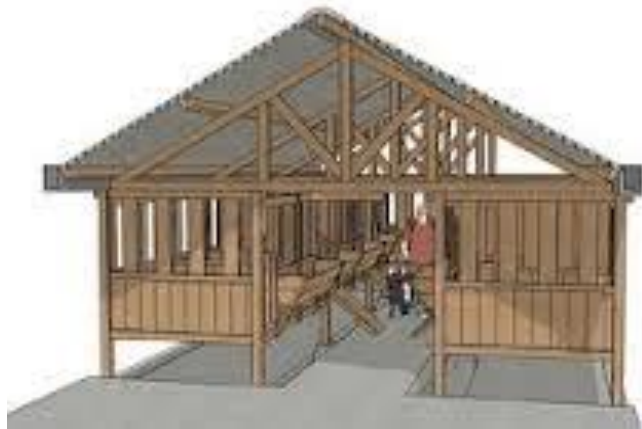
Gambar: Kandang Panggung

Kandang panggung merupakan kandang yang konstruksinya dibuat panggung atau di bawah lantai kandang terdapat kolong untuk menampung kotoran. Adanya kolong dapat menghindari kebecakan, menghindari kontak dari tanah yang mungkin tercemar penyakit, dan memungkinkan ventilasi kandang yang lebih bagus. Lantai kandang ditinggikan antara 0,5 s/d 1 meter. Dengan bahan yang sama, kandang dengan panggung yang pendek akan lebih kokoh dibandingkan dengan kandang berpanggung tinggi.