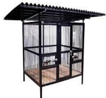
Gambar Kandang individu yang beratap dari logam