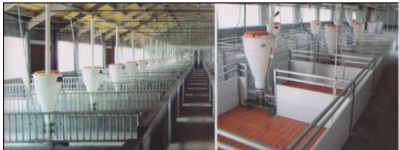
Gambar: Kandang Koloni/kelompok

Kandang koloni merupakan kandang yang tidak memiliki penyekat, walaupun disekat, ukuran kandang relatif luas. Untuk memelihara beberapa babi sekaligus. Luas kandang disesuaikan dengan umur bakalan dan jumlah ternak yang dipelihara.